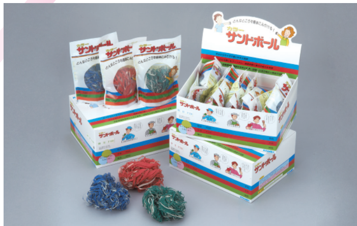
カラーサンドボール