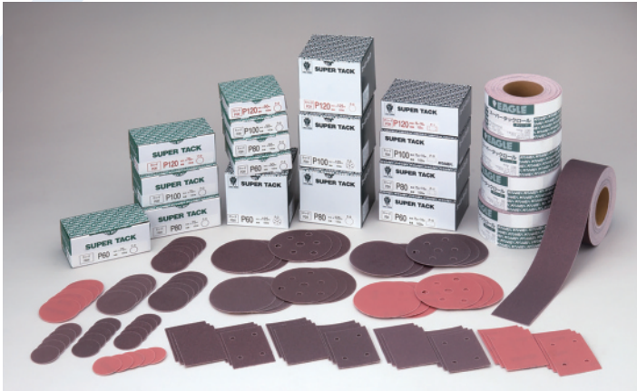
スーパータック Pハード