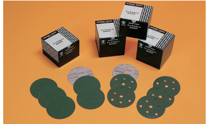
スーパータック マックスカット